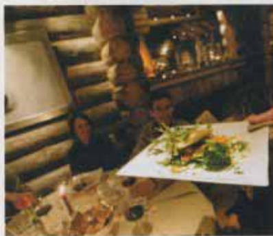
La Cabane des Praz : village des Praz, Chamonix. Tél. : 04 50 53 23 27.

Pour bien débiter la semaine, rendez-vous à La Cabane. Ce restaurant en rondins mêle design et ambiance trappeur. La cuisine se veut traditionnelle mais raffinée, au coin du feu, peau de bête à l'appui. Ainsi, on ne déroge pas au rituel de la fameuse tartiflette au reblochon des Aravis, alors que la fondue s'agrémentent, elle, de gruyère suisse et de vacherin fribourgeois.