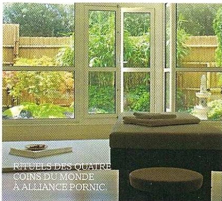
RITUELS DES QUATRE COINS DU MONDE A ALLIANCE PORNIC.

• Réservations au 04 50 54 65 36, www.lesgrangesdenhaut.com .